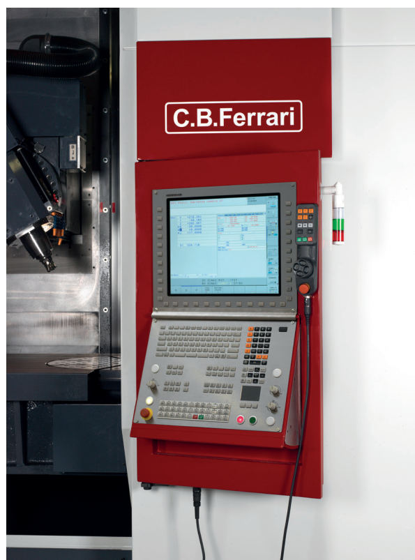
Il controllo numerico Heidenhain che equipaggia la serie GT.

I due modelli GT 1600 e GT 2000 possono essere configurati a 3, 4 o 5 assi continui. Nella versione a 5 assi è prevista una tavola girevole con piattaforma diametro da 750 o 840 mm, annessa in una semitavola sagomata con dimensioni 1.500x1.000 mm, in modo che il piano di lavoro sia perfettamente sullo stesso livello, per permettere di eseguire facilmente l'esecuzione di lavorazioni a 3 o a 4 assi.